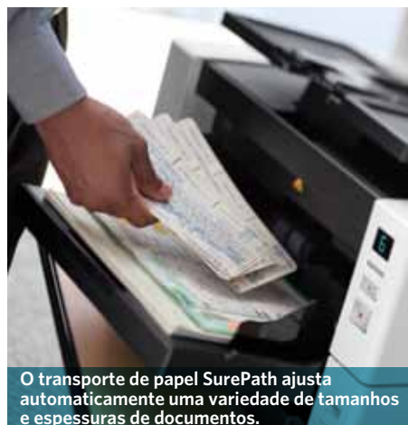
O transporte de papel SurePath ajusta automaticamente uma variedade de tamanhos e espessuras de documentos.

O menor scanner em sua classe a oferecer capacidade de entrada de 500 folhas.